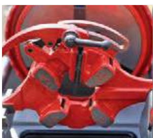
Автоматическая резьбонарезная головка 1/2 – 2"